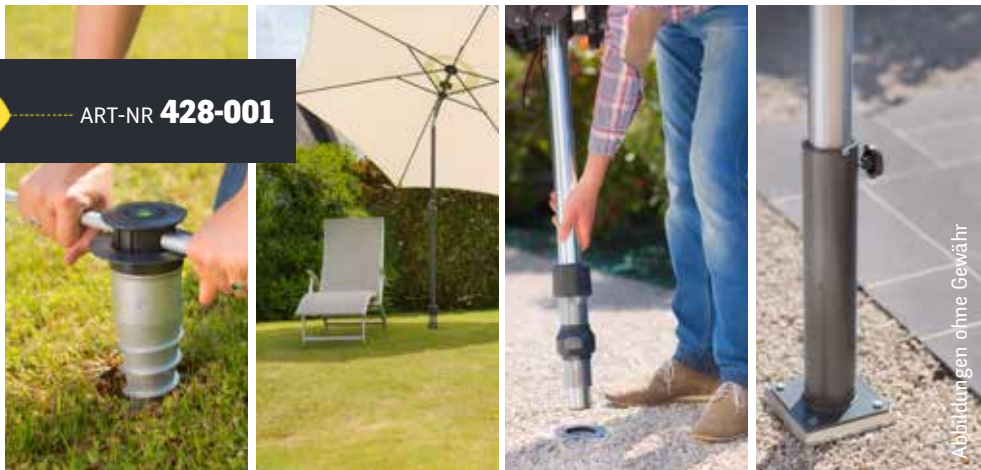
Abbildungen ohne Gewähr

Die GARD&ROCK-Bodenhülse aus Druckgussaluminium und hochwertigem Spritzgusskunststoff mit hoher UVBeständigkeit ist auf eine lange Lebensdauer ausgelegt.